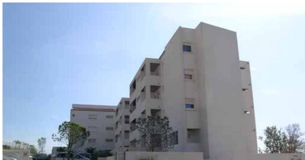
Marseille 15 ème